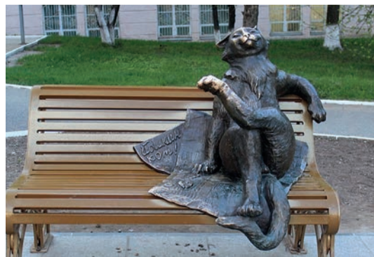
Йошкин кот – мастер на все лапы