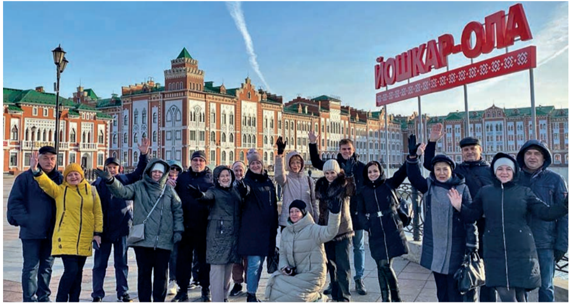
15 поездок устроили для сотрудников «Тольяттиазота» в 2023 году профсоюз и администрация. 550 заводчан побывали на экскурсиях по Самарской области и Поволжью

Кроме часов с библейскими персонажами, коллегу впечатлила органная музыка в местном театре оперы и балета и... торт в виде Мариинского театра. Местные кондитеры преподнесли его балетмейстеру за премьеру, но служители Терпсихоры, преодолев соблазн полакомиться подарком, сохранили произведение кондитерского искусства для потомков.